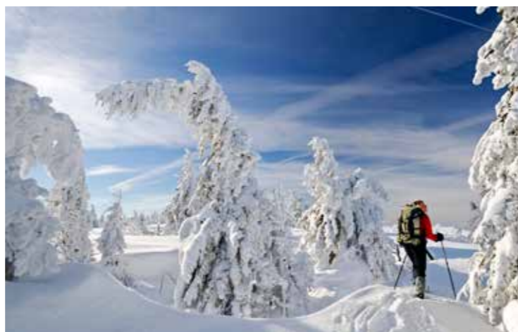
Office de Tourisme de la Vallée de Munster, Crédits photos OTVM - Quentin Gachon / Benoît Facchi

Profitez du calme de la nature pour découvrir la montagne hivernale de nuit. 2h de balade pour vous mettre en appétit puis repas typique dans un refuge ou une auberge de montagne en option.